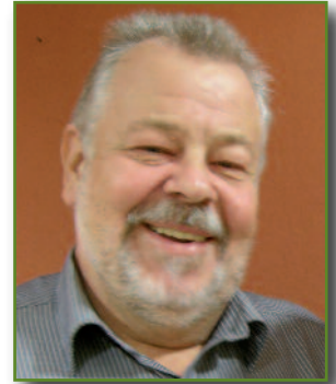
Leitung: Wilfried Damböck, Geobiologischer Berater, Baubiologe, Rutenmeister und -lehrer, Fachbuchautor

Die Baubiologie ist ohne Zweifel ein sehr vielfältiges und umfangreiches und vor allem auch ein Interessantes Thema.